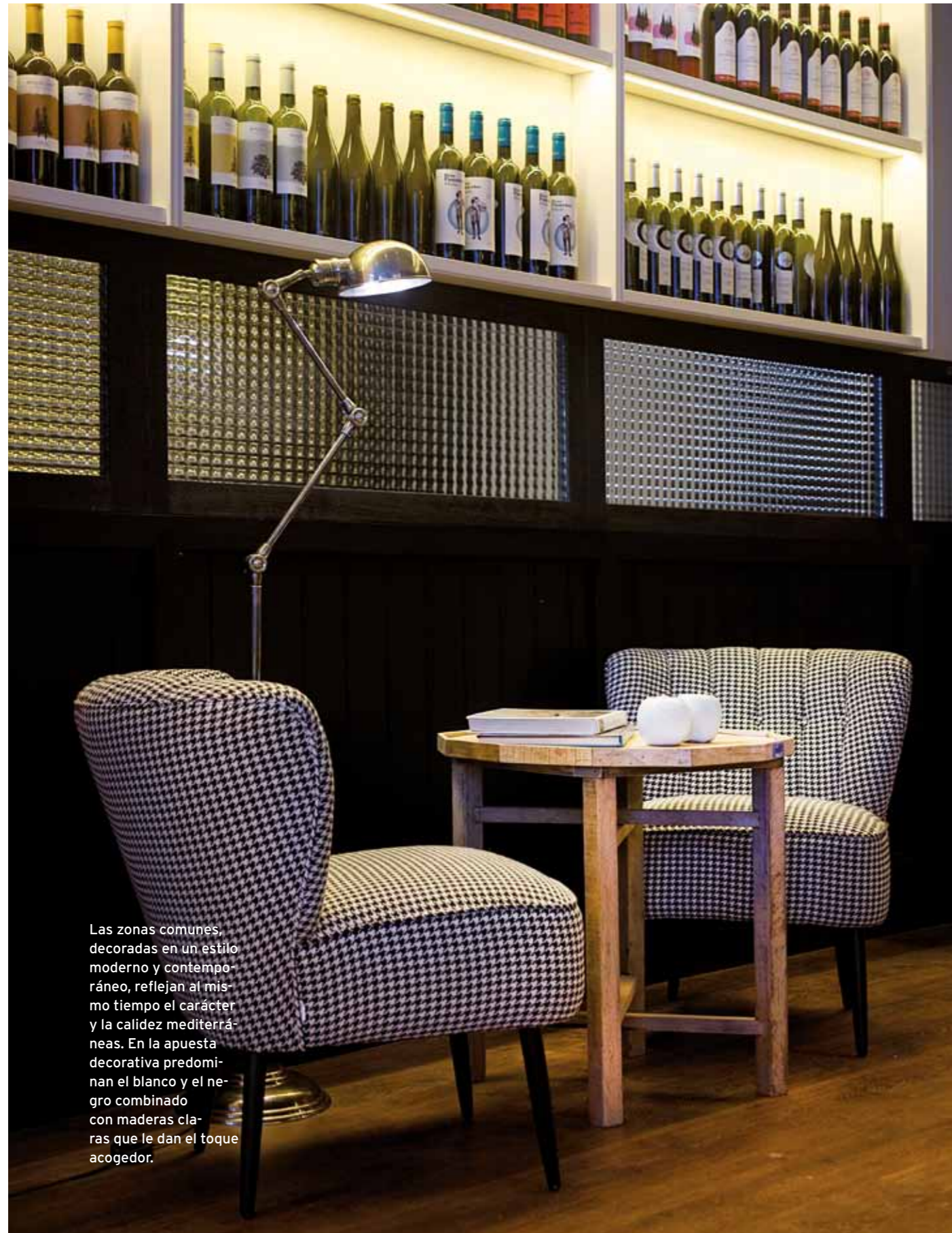
Las zonas comunes, decoradas en un estilo moderno y contemporáneo, reflejan al mismo tiempo el carácter y la calidez mediterráneas. En la apuesta decorativa predominan el blanco y el negro combinado con maderas claras que le dan el toque acogedor.